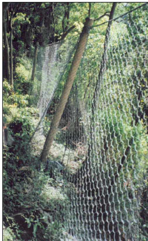
Ecran parepierres ELSA 12,5 KJ