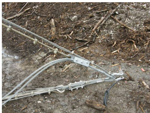
Bloc frein au niveau de l'ancrage amont