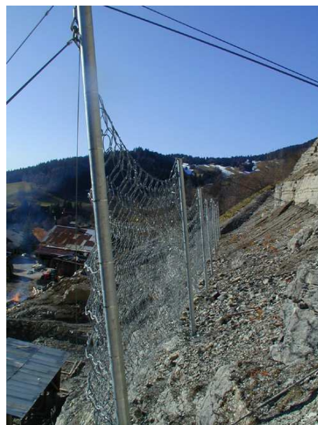
Ecran parepierres CAN D 1000 KJ

Dissipation d'énergie par déformation réversible de l'écran, et mise en place de freins sur les câbles amont pour des énergies supérieures à 1000 KJ