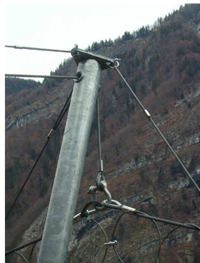
Détail tête de poteau écran parepierres CAN D 1500 KJ